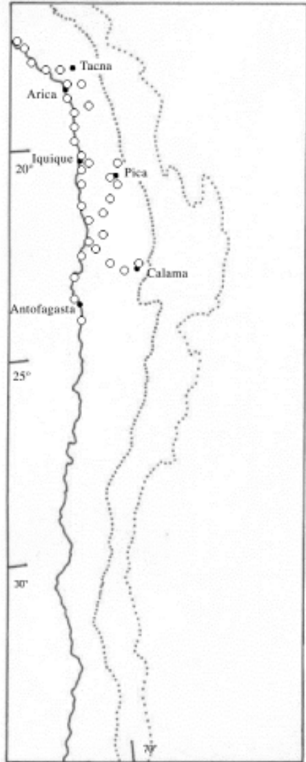
Figura 2. Distribución geográfica de Phyllodactylus gerrhopygus (Wiegmann) en Chile y Perú Figure 2. Geographic distribution of Phyllodactylus gerrhopygus (Wiegmann) in Chile and Peru

Inicialmente resulta muy necesario discutir acerca de los principios generales de la nomenclatura utilizada por Capetillo et al. (1992), quienes establecieron algunos caracteres diagnósticos para diferenciar a P. gerrhopygus y P. inaequalis (fide Donoso-Barros, 1966). Estos autores señalan que la población distribuida en la costa de Chile, entre Iquique y Antofagasta, y ampliamente distribuida por la costa peruana (área que incluye el sistema biocenótico de Tacna), correspondería a P. inaequalis , mientras que aquella distribuida en “el interior de Iquique, tanto en los Oasis del desierto como en Mamiña, en la precordillera” y en La Huayca (al noroeste de Pica) correspondería a P. gerrhopygus . Tales identificaciones resultan erróneas si se tiene en consideración que la tierra típica de