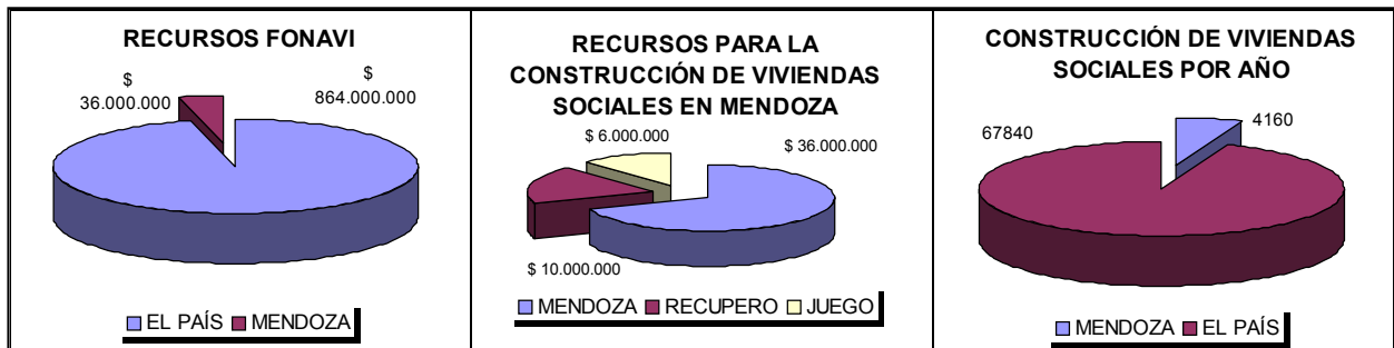
Figura 1. Recursos para el financiamiento de la Vivienda Social en Mendoza, Argentina.

Considerando el déficit de vivienda, se estima que se requiere una inversión de 55.000 millones de pesos en aproximadamente 11 años, lo que significa un 3% del P.B. anual. Esto equivale a 400.000 vivienda por año (sólo se construyen aproximadamente 72.000 unidades, es decir el 18%), dependiendo esta inversión de la capacidad de ahorro del estado, la que debe superar el 21 % del ingreso nacional. (Datos de 1998).