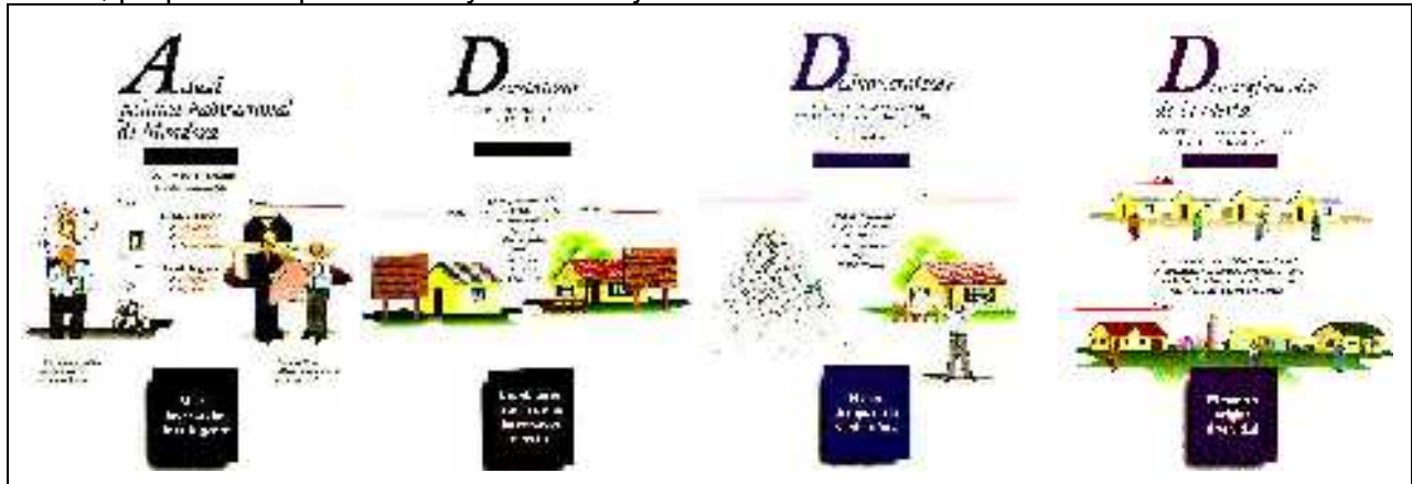
Figura 2. Cartilla de difusión de la Política de Descentralización del Instituto Provincial de la Vivienda de Mendoza.

asumieron estas nuevas responsabilidades demandando del campo científico, tecnológico y social, propuestas que contribuyeron al mejoramiento de la vivienda social 6 .